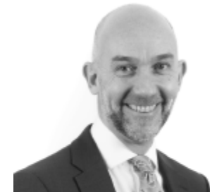
Adrian Crompton Archwilydd Cyffredinol Cymru