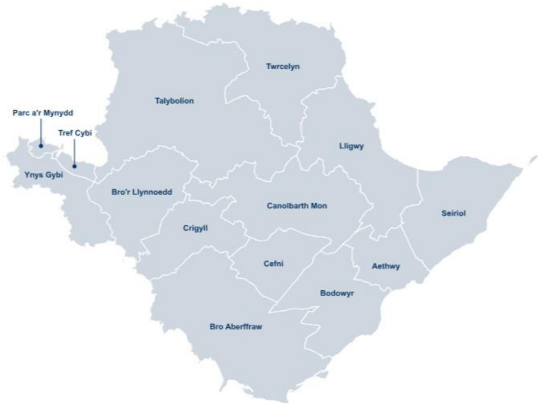
Diagram 2: Ardal CDLI